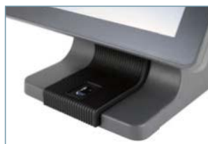
Fingerprint & iButton на выбор