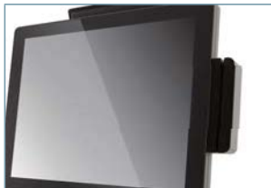
Считыватель магнитных карт