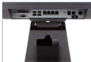
Подставка с помещением для адаптера и кабелей