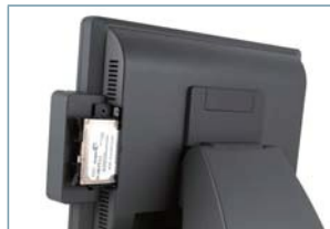
Простая и быстрая замена HDD